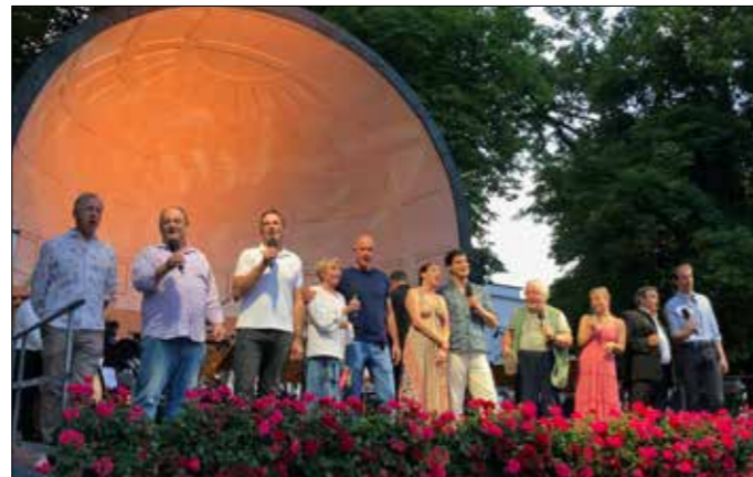
Die Stars der Operette „Der fidele Bauer“ begeisterten mit der Stadtkapelle Bad Hall auch das Publikum der Nacht der 1000 Klänge.

der heimischen Blätter mit ausnahmslos positiver Kritik geschafft. Die Operette erfreut sich, wenn professionell und künstlerisch gut umgesetzt, großer Beliebtheit, was dem Bad Haller Weg, ein drei Spartenangebot zu setzen, recht gibt. Wir freuen uns auf die Oper „Die Zaubrerflöte“ ab 8. September 2023 und „Den kleinen Horrorladen“ ab 14. Oktober 2023 in unserem Stadttheater. Karten dafür sind jederzeit verfügbar und eignen sich auch hervorragend als Geschenke zu verschiedenen Anlässen. Die Freude darüber, dass erfolgreich Kultur auf hohem Niveau angeboten und Bad Hall von vielen Interessierten besucht wird, macht uns stolz. Danke an den Bürgermeister und den Gemeinderat, die diese Projekte ermöglichen. Der Kulturausschuss beschäftigt sich intensiv mit dem