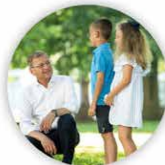
Thomas Stelzer Landeshauptmann

„Die beste Bildung braucht auch die besten Rahmenbedingungen. Wir wollen Oberösterreich zum Kinderland Nr. 1 machen.“