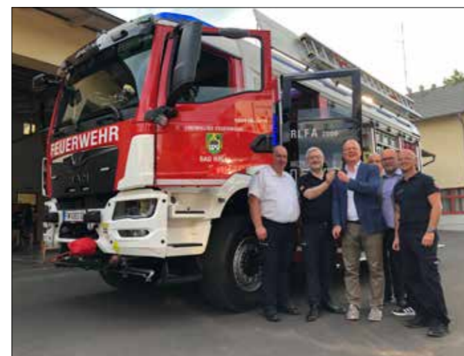
Für mehr Sicherheit in Bad Hall, unsere Feuerwehr und modernste Technik für ihre so wertvolle Arbeit.