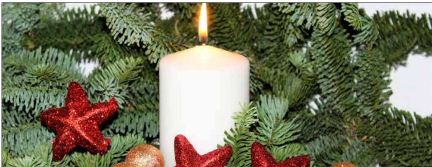
Licht und Leben – Kraftschöpfen für ein neues Jahr