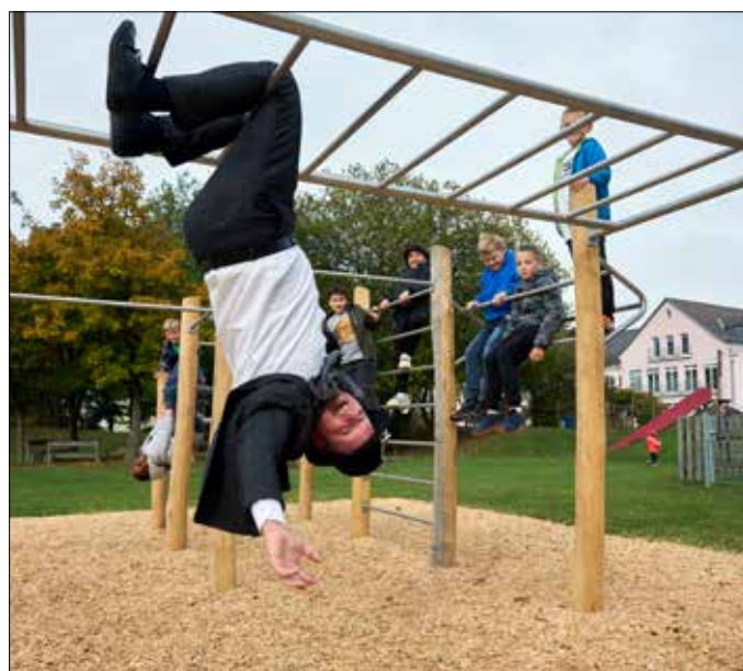
Nach einem verrückten Jahr darf man sich auch einmal hängen lassen.