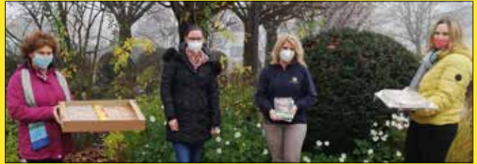
Heimleitung und Pflegedienstleitung nahmen freudig die süße Stärkung entgegen.

Das Jahr 2020 ist für viele Menschen ein sehr forderndes Jahr. Anlässlich des „Tags des Apfels“ am Freitag, 13. November, übergaben die Bäuerinnen aus dem Bezirk selbstgemachten Apfelkuchen an das Personal der Altenheime. Dies soll ein Zeichen der Wertschätzung für ihre anspruchsvolle Arbeit sein.