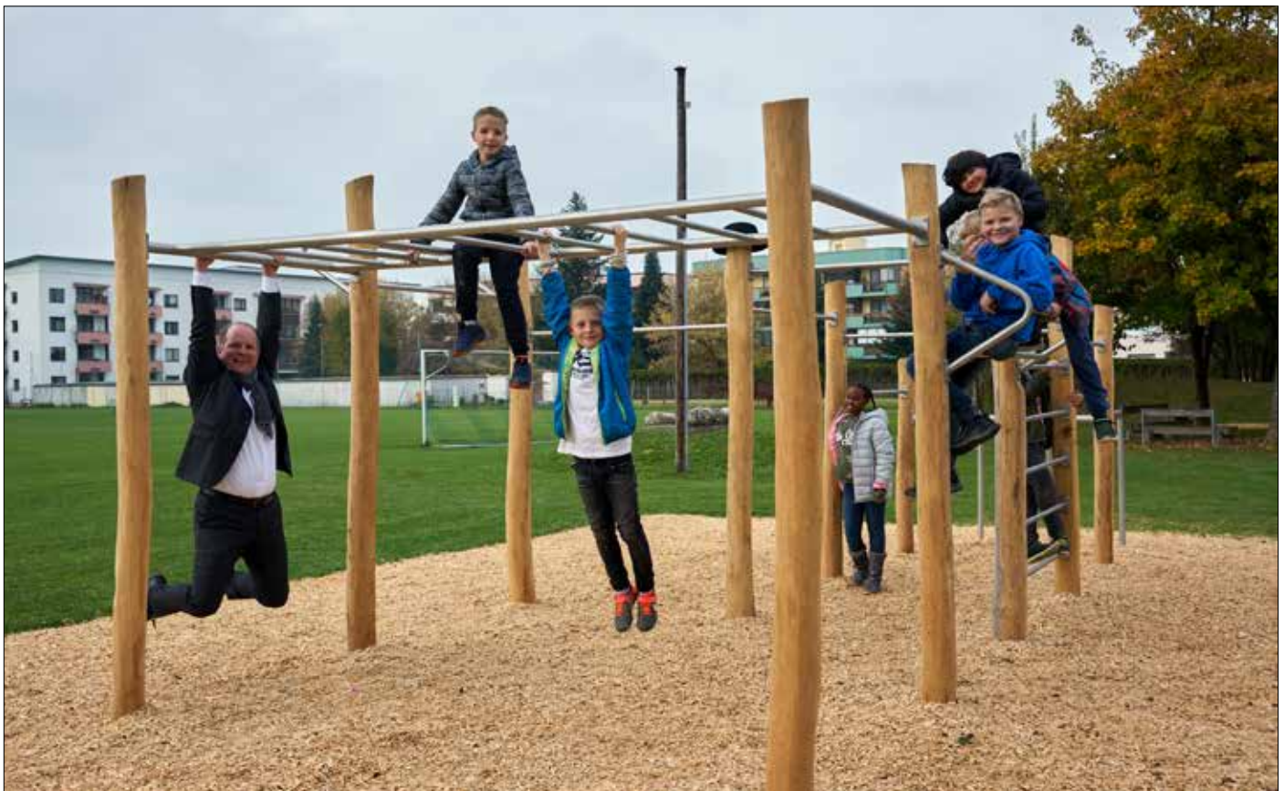
Auch die neue Calisthenics-Anlage dient unserer Gesundheit – für Jung und Alt