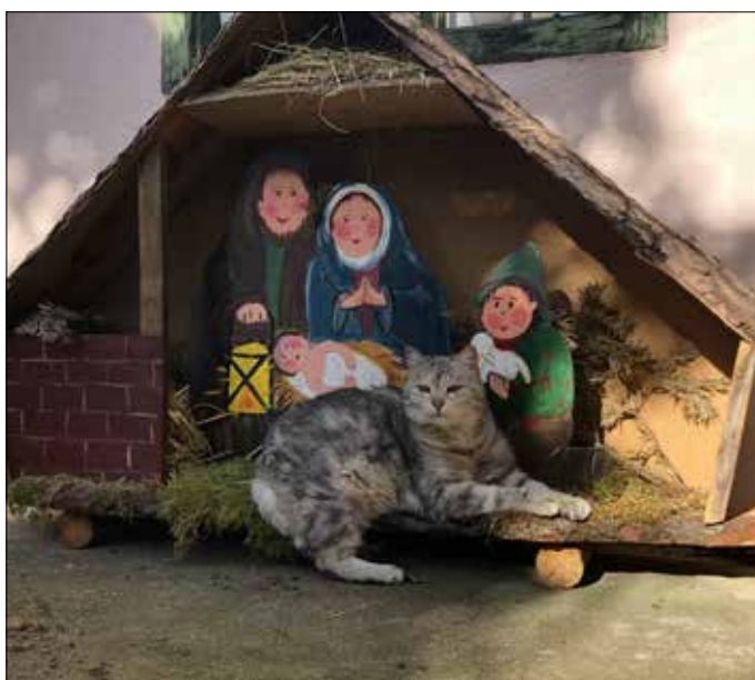
Mach es wie die Krippenkatten, bleib beim Stall und streck die Tatzen.