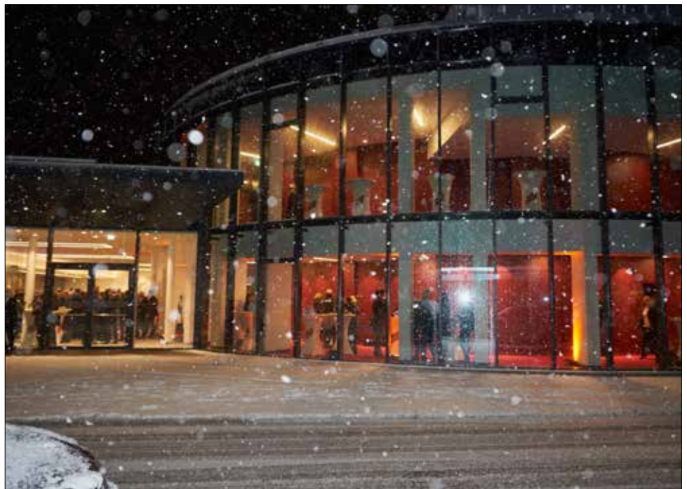
Im behördlichen Winterschlaf befindet sich derzeit unser Theater.

In diesem Sinne wünsche ich uns allen ein gesundes Weihnachtsfest in der Hoffnung auf ein gutes neues Jahr. Maria Riegl