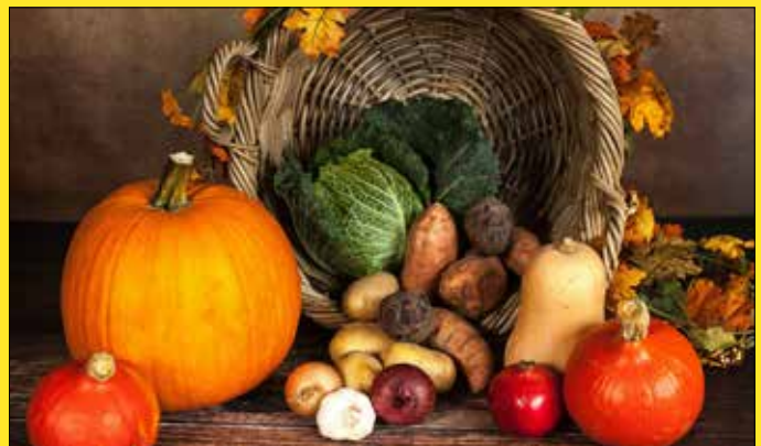
Der Herbst bietet viele natürliche Köstlichkeiten.