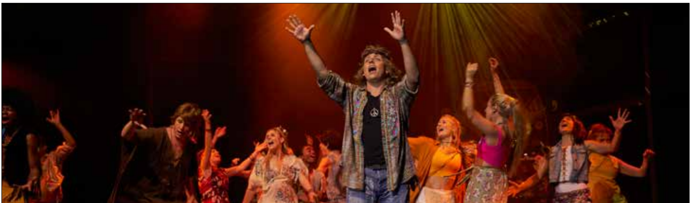
Garantiert bunt und gemütsaufhellend: HAIR-Das Musical