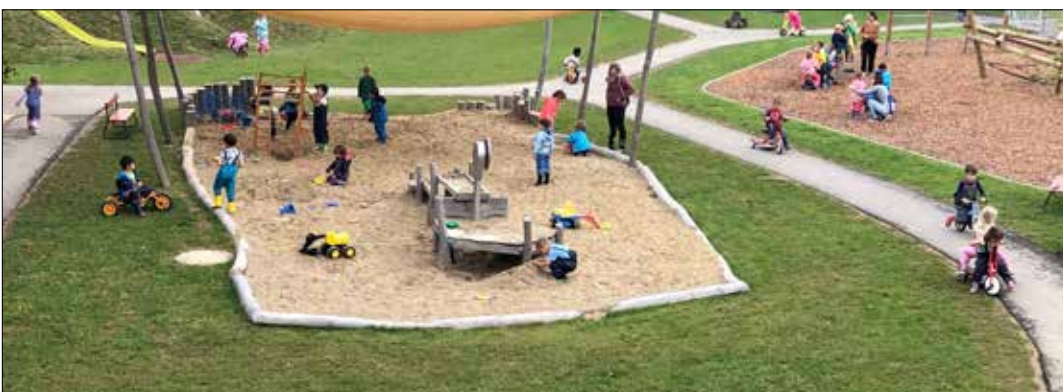
Foto links: Der neue Kindergarten-Garten lässt Kinderherzen höher schlagen.