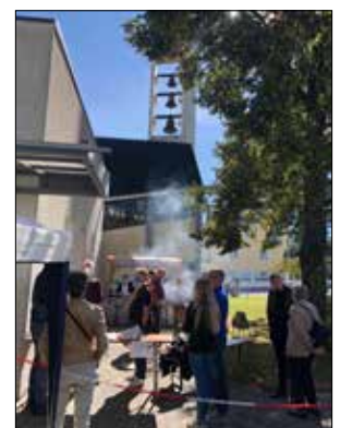
Foto rechts: Großer Andrang herrschte beim Brauchtumssonntag rund um die begehrten Krautwickler und Baumstämme.