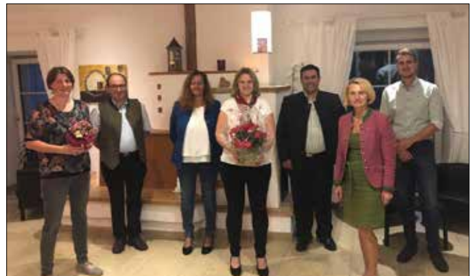
Der neue Vorstand des Bad Haller Bauernbundes

Nur eine Bauernvertretung wie der Bauernbund, der eine starke Regierungspartei im Rücken hat, kann die Interessen der Bäuerinnen und Bauern gut vertreten!