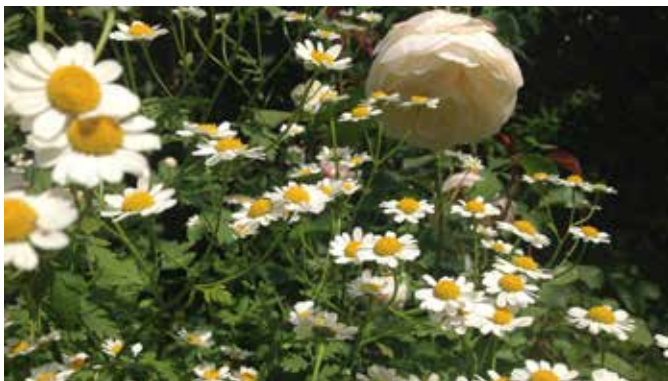
Für unsere Umwelt – Für unsere Natur

Straßen. Dosen, Flaschen und anderer Unrat, egal wie bunt sie sind, ersetzen keine Wildkräuter und Blumen. Im Gegenteil. Sie erschweren auch die Bewirtschaftung von Wiesen und Feldern und stellen zusätzlich eine Gefahr für Menschen, Tiere und Boden dar.