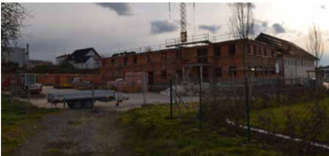
Im ehemaligen Vierkanthof am Holznerweg 4 entstehen derzeit 23 Mietwohnungen. Anbei werden 2 Miet-Reihenhäuser mit je 3 Wohneinheiten gebaut.