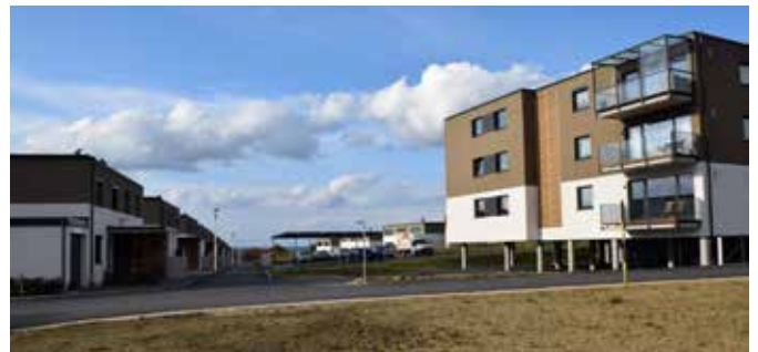
Die neue Siedlung „Am Sonnenfeld“ am ehemaligen Parkplatz der Landesgartenschau ist bereits zum Teil fertiggestellt und hat sich harmonisch in die Umgebung eingefügt.