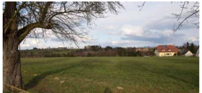
Ein neues Siedlungsgebiet entlang der Linzerstraße Richtung Riedlhub ist in Planung.