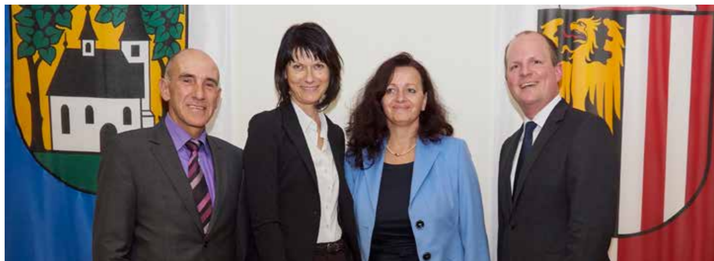
Bürgermeister und Vizebürgermeister strahlen nach der Angelobung mit Bezirkshauptfrau Cornelia Altreiter-Windsteiger um die Wette.