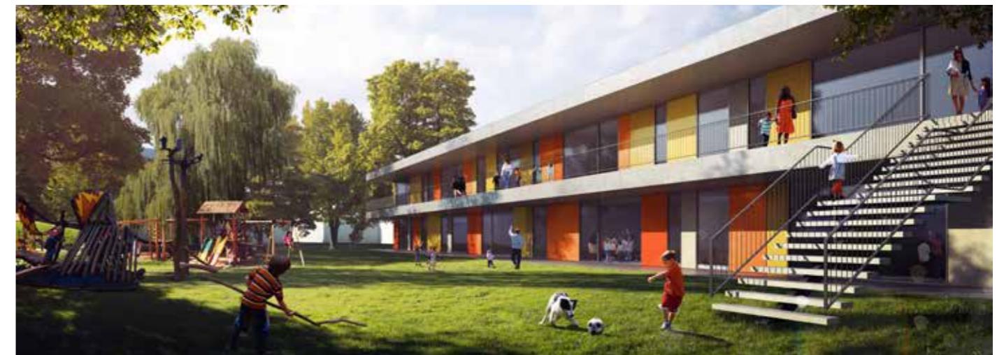
So soll der neue Kindergarten ausschauen.